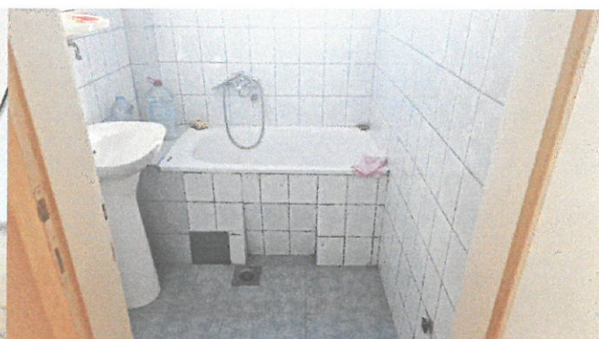
Слика 6. – Купатило