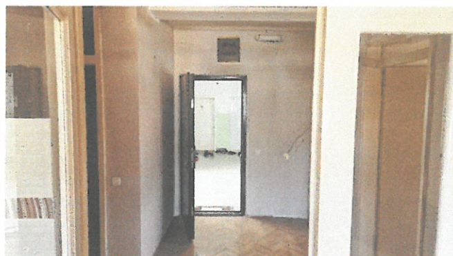
Слика 7. – Ходник