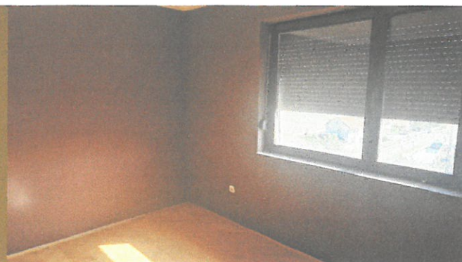
Слика 4. – Спаваћа соба 2