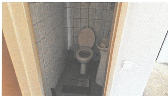
Слика 5. – Посебни ВЦ