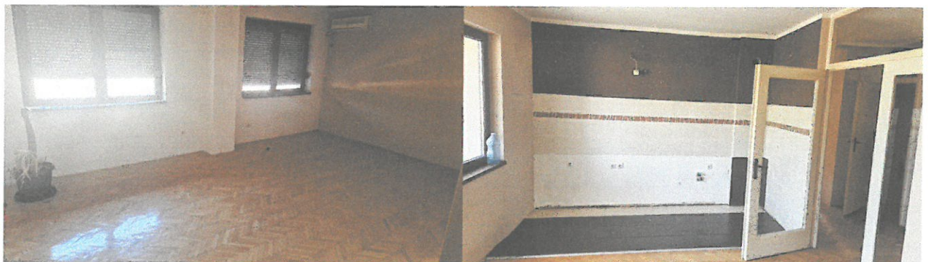
Слика 1. – Дневна соба

Изглед и стање пословног простора је на сликама од 1 до 8