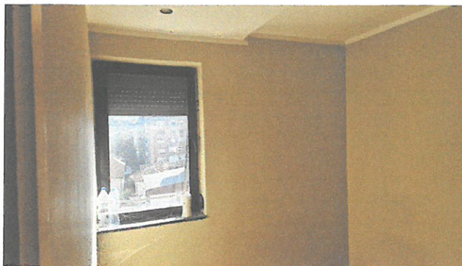
Слика 3. – Спаваћа соба 1